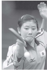
福原爱 Fúyuán Ài