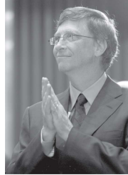
比尔·盖茨 Bǐ'ěr Gàicí