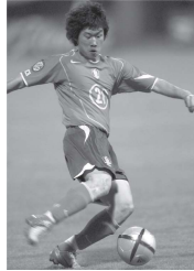
朴智星 Piáo Zhīxīng