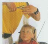
ケープ robe 罩衫