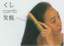
くし comb 发梳