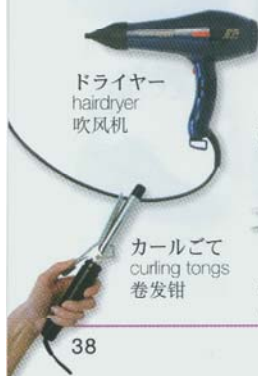
ドライヤー hairdryer 吹风机