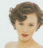
セットする set (v) 定型