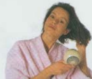
ドライヤーで乾かす blow dry (v) 吹干