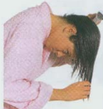
すすぐ rinse (v) 冲洗