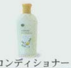
コンディショナー • conditioner • 护发素