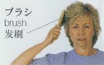
ブラシ brush 发刷