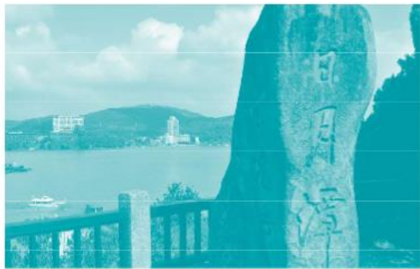
台湾著名景点日月潭

朋友们还在呼呼地睡大觉呢。除了陆地面积以外，中国还有约 473 万平方公里的海洋面积，5000 多个岛屿，其中台湾岛是中国最大的岛屿。