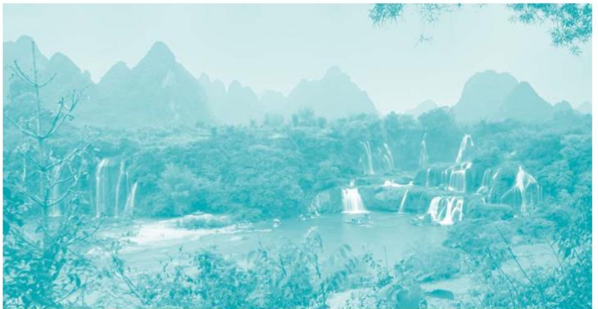
位于广西大新县的德天瀑布

China has a vast territory and a large population. The people from 56 ethnic groups compose a large harmonious family.