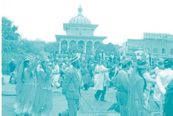
新疆维吾尔族的人们能歌善舞