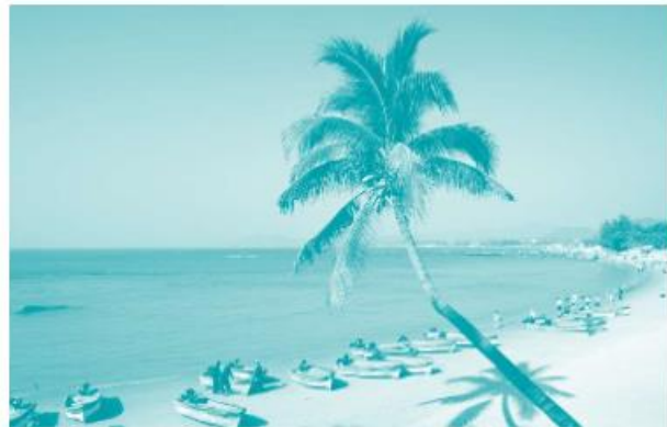
位于中国南海边上的三亚

中国位于亚欧大陆东部，太平洋西岸，陆地边界长达2万多公里。中国的东边是朝鲜，北边是俄罗斯和蒙古，西北有哈萨克斯坦、吉尔吉斯斯坦、塔吉克斯坦，西边和西南有巴基斯坦、阿富汗、印度、尼泊尔、不丹，南边与缅甸、老挝、越南相接，共有14个陆上邻居。中国的东边和南边有渤海、黄海、东海和南海，跟世界上最大的海洋——太平洋相连。