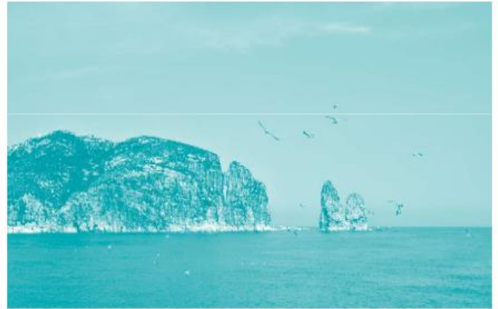
黄海、渤海交界处的山东烟台万鸟岛

The total area of China is 9.6 million square kilometers, ranking the third in the world. Russia ranks the first and Canada follows. The United States is the fourth largest country. From China's southernmost part to its northernmost, and from its easternmost part to its westernmost, the lengths are