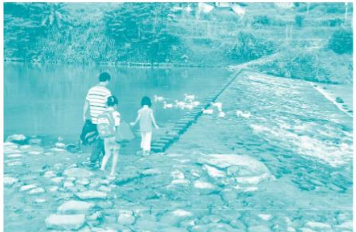
背着书包去上学的南方孩子